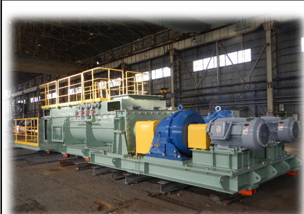
ダウミキサー外観