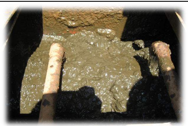
ダウミキサー機内スラリー状況

株式会社新日南 京浜事業所 〒224-0044 横浜市都筑区川向町957-30 電話045-472-7703 FAX045-472-1701