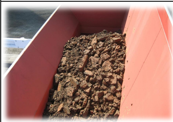
脱水ケーキホッパ